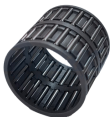
ROLAMENTO ENGRENAGEM RÉ - CÂMBIO EATON 2405 E 2305

APLICAÇÃO: S10, RANGER, SILVERADO, IVECO SKU: 44830