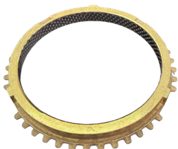
ANEL SINCRONIZADO RÉ CÂMBIO 2405

APLICAÇÃO: RANGER/S-10 /FRONTIER/DAILY SKU: 40586