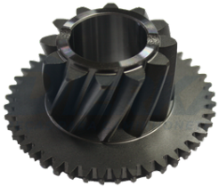
ENGRENAGEM DA RÉ CAIXA 2405

APLICAÇÃO: RANGER / S-10 / FRONTIER / DAILY SKU: 33118