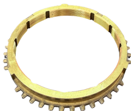
ANEL SINCRONIZADO 5 CX 2405

APLICAÇÃO: S-10, RANGER, TROLLER, IVECO DAILY, 35S14 SKU: 44473