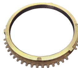
ANEL SINCRONIZADO DE 1ª A 4ª CAIXA 2405

APLICAÇÃO: RANGER/S-10 /FRONTIER/DAILY SKU: 38911