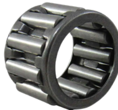
ROLAMENTO INTERNO EIXO PILOTO