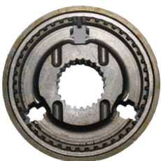
CONJUNTO SINCRONIZADOR 5ª/RÉ CAIXA 2405

APLICAÇÃO: RANGER/S-10 /FRONTIER/DAILY SKU: 38911