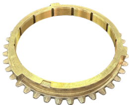
ANEL SINCRONIZADO 1ª/4ª/5ª