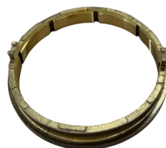
ANEL SINCRONIZADO 5ª MARCHA

APLICAÇÃO: HILUX 05/15 / TRITON 3.2 SKU: 41995