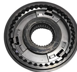
KIT LUVA + CUBO HILUX E TRITON 3/4 05/15

APLICAÇÃO: HILUX E TRITON 05/15 SKU: 41990