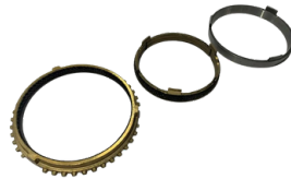
KIT ANEL SINCRONIZADO TRIPLO DE 1ª MARCHA

APLICAÇÃO: HILUX 05/15 E TRITON 3.2 SKU: 40581