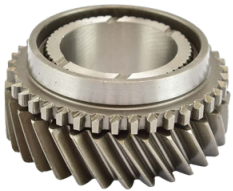
ENGRENAGEM 3ª HILUX