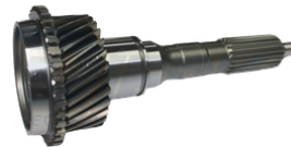
EIXO PILOTO HILUX 05/15

APLICAÇÃO: HILUX 05/15 E TRITON 3.2 SKU: 40582