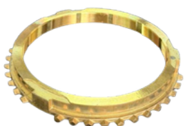
ANEL SINCRONIZADO 3ª MARCHA HILUX 05/15